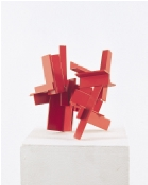
Christoph Freimann geboren 1940 in Leipzig Ohne Titel, 2001 Messing, Lack 24 x 25 x 24 cm Signiert und datiert