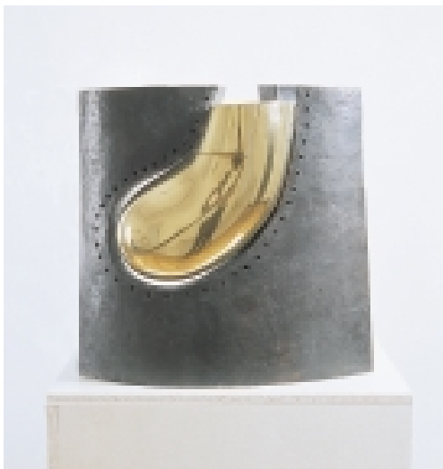
Bernhard Heiliger 1915 Stettin – 1995 Berlin Naissance d'une forme, 1980 Bronze, teilweise poliert 50 x 51 x 25 cm Auflage: 5 Exemplare (posthum)