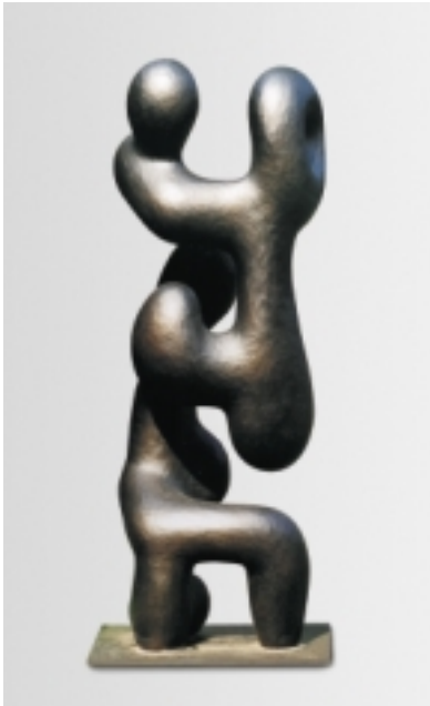
Hans Steinbrenner geboren 1928 in Frankfurt/M. Komposition, 1958 Bronze 104 x 34 x 30 cm Auflage: 6 Exemplare