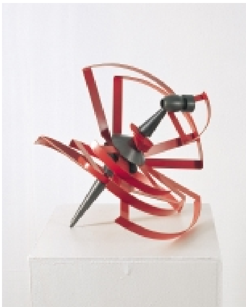
Gerlinde Beck geboren 1930 in Bad Cannstatt Monument für Josephine Baker, 2004 Messing, Stahl 37 x 25,4 x 38 cm