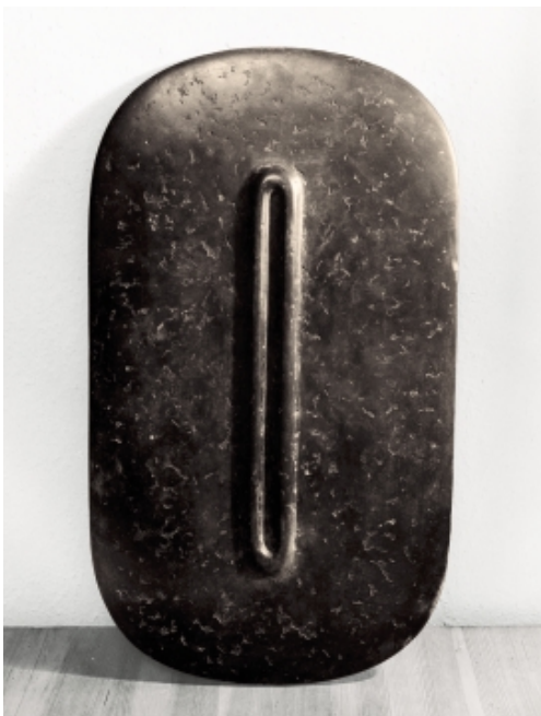
Herbert Baumann 1927 Blumberg – 1990 Stuttgart Antlitz, 1987 Bronze 60 x 35 x 1,5 cm Unikat