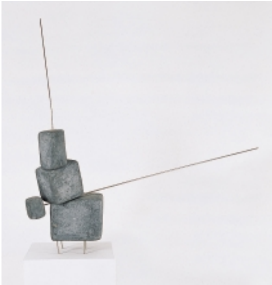
Thomas Lenk geboren 1933 in Berlin Objekt 18, 1963 Beton und verzinktes Eisen 78 x 93 x 23,5 cm Signiert und datiert