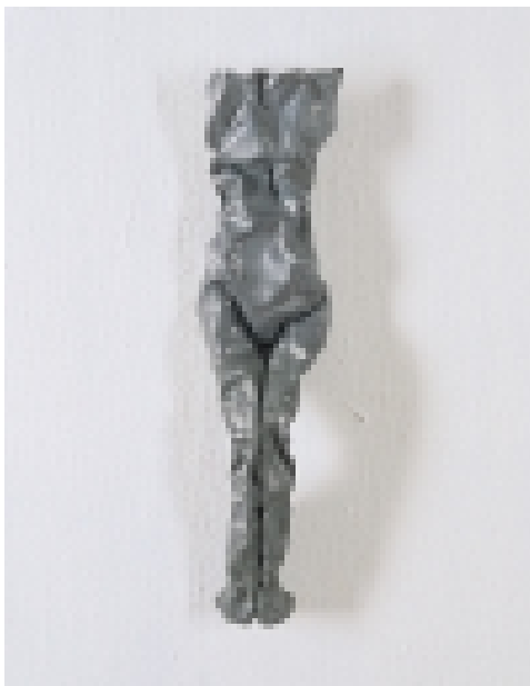
Jürgen Brodwolf geboren 1932 in Dübendorf/Zürich Torso, um 1975 Blei 50 x 12 x 8 cm Signiert