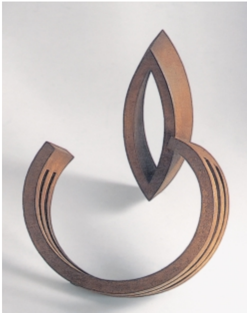
Werner Pokorny geboren 1949 in Mosbach Zwei durchbrochene Formen, 1995 Corten 51 x 50 x 70 cm Auflage: 5 (+1) Exemplare