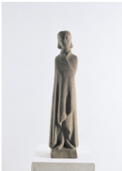
Gerhard Marcks 1889 Berlin – 1981 Köln Jungfrau, 1947 (Maquette für den Figurenfries der Katharinenkirche in Lübeck) Terracotta 55 x 13 x 12 cm Kleine, nicht nummerierte Auflage