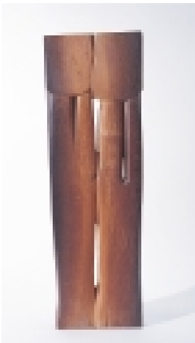
Eva Zippel geboren 1925 in Stuttgart Wald, 1972 Mooreiche 89 x 29 cm Signiert