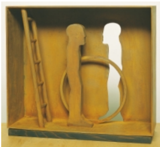
Horst Antes geboren 1936 in Heppenheim Interieur (mit Rückwand) mit stehender Figur und Leiter, 1980 Stahl, massiv 38 x 45 x 14,7 cm Signiert und nummeriert Auflage: 6 Exemplare