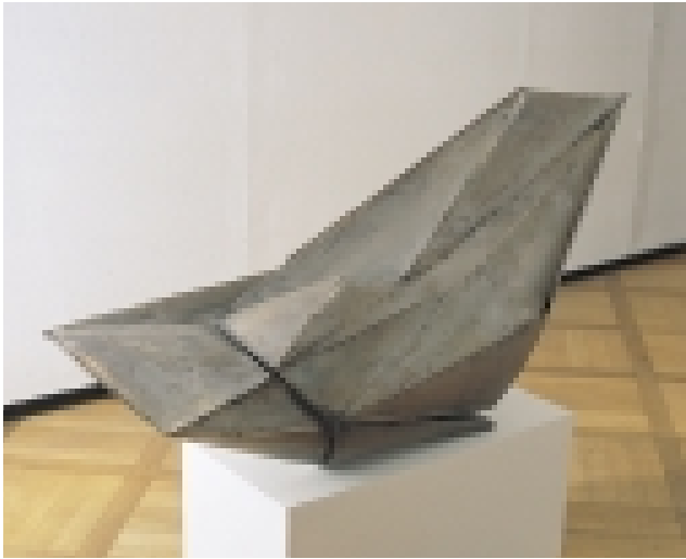
Erich Hauser 1930 Rietheim – 2004 Rottweil Stahl 5/65, 1965 Stahl 60 x 150 x 58 cm