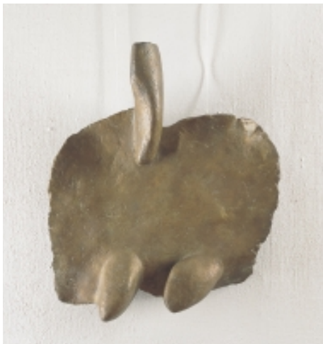
Wilhelm Loth 1920 Darmstadt – 1993 Darmstadt Reliefbüste 18/60 – Nike-Büste, 1960 Bronze 67 x 58 x 18 cm Auflage: 5 (+1) Exemplare