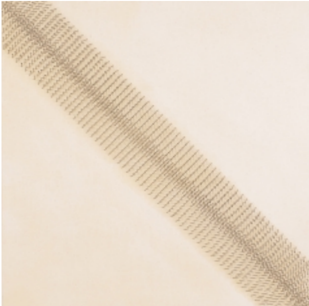
Günther Uecker geboren 1930 in Wendorf/Mecklenburg Diagonale Teilung gegeneinander, 1965–74 Nägel auf Leinwand auf Holz 100 x 100 cm signiert, betitelt und datiert