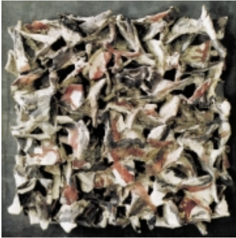
Emil Cimiotti geboren 1927 in Göttingen Mistral V, 1988/89 Bronze auf Stahl, teilweise bemalt 50 x 50 x 7 cm Signiert