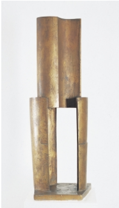
Anton Hiller 1893 München – 1985 München Torso, 1970 Bronze 104 x 35 x 31 cm Auflage: 3 Exemplare