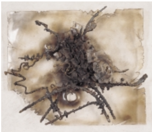
Paul Reich geb. 1925 in Aue/Sachsen Relief Buntmetalle 60, 1960 Buntmetalle, Glas 55 x 65 x 15 cm